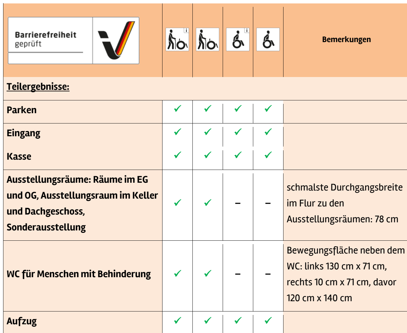
Tabelle 1: Überblick über das Prüfergebnis