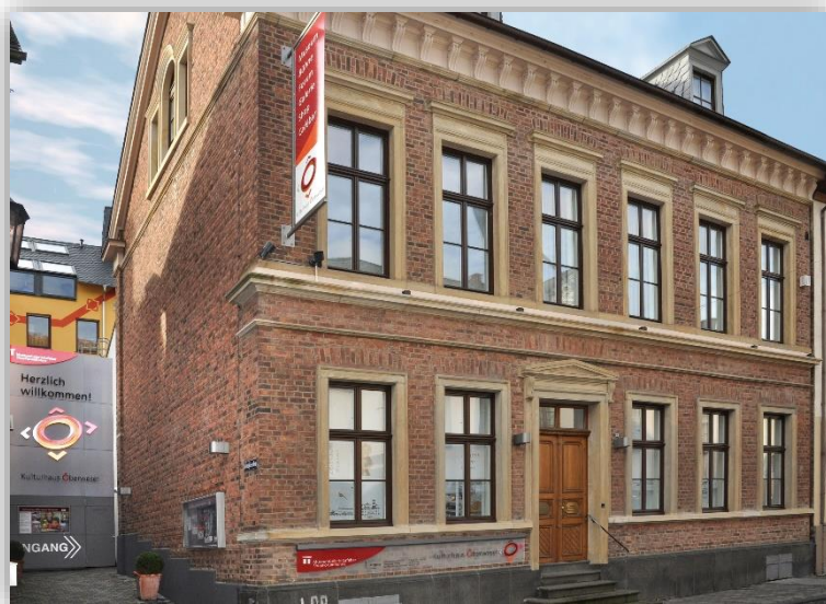
Außenansicht Kulturhaus Oberwesel